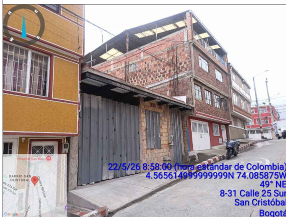
VISTA LATERAL IZQUIERDA PREDIO