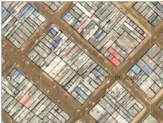
LOCALIZACIÓN PREDIO (CALLE 25 SUR # 8 - 36 ESTE)