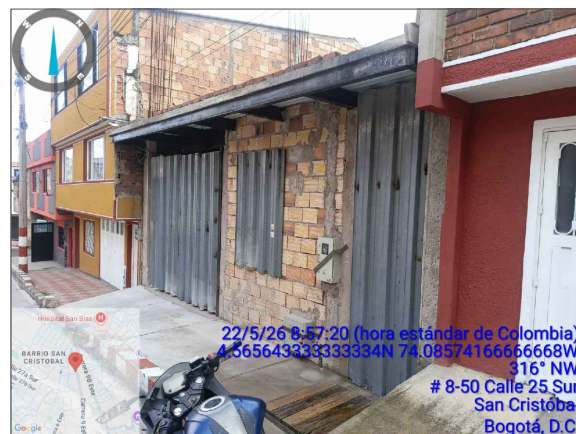
VISTA LATERAL DERECHA PREDIO