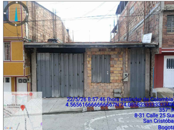
VISTA FRONTAL PREDIO